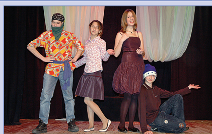
Новогодний карнавал 6