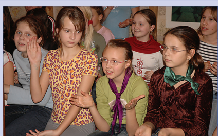
Экологический лагерь 2-3

Печатный орган детской организации "Остров Сокровищ" Гимназия №45 Газета основана в 1997 году