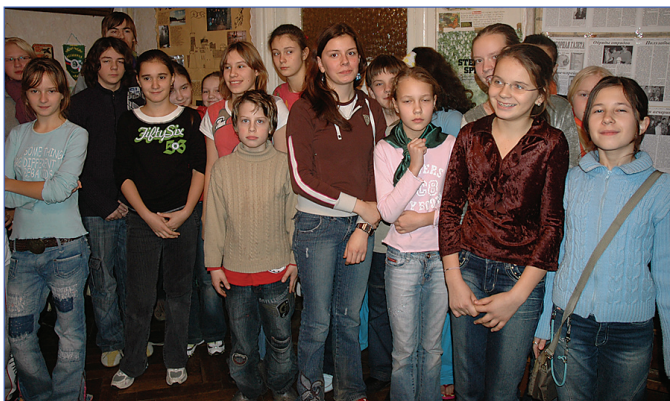
Отряды на линейке

Очень хочу поехать на следующий сбор организатором. Инструктором еще рано. А всем остальным желаю стремиться к своей цели и добиваться ее, как почти добилась ее я.