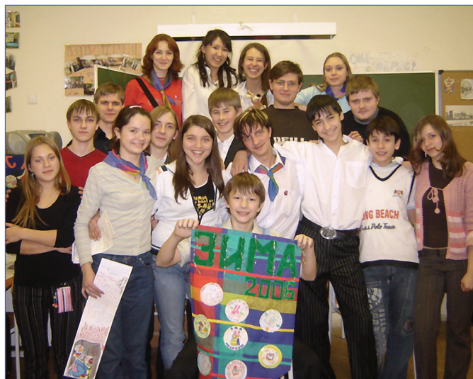
Организаторы и инструктора

Несомненно, этот день не мог обойтись без самого бала. Все пришли нарядные, а некоторых было даже в масках не узнать!