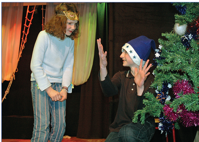
Чудеса под елочкой

И вот оно, второе января. Начался Новый Год, и как ни обидно это понимать, этот карнавал остался в старом году... Но ведь у нас еще много лет и много карнавалов. Так что не стоит грустить и отчаиваться, а стоит надеяться на лучшее.