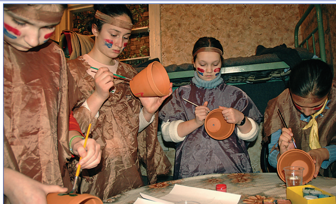
Разрисовывая индейские горшки

На следующий день у нас было ландшафтоведение. В лаборатории мы подготовились к по-