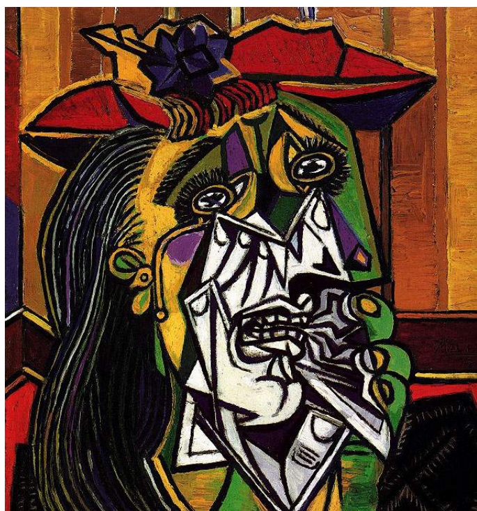
Пабло Пикассо «Плачущая женщина» 1937 год