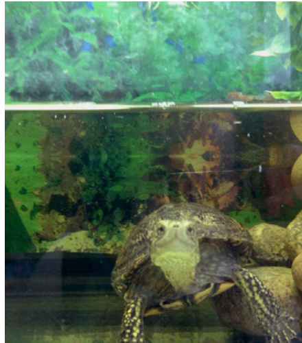
Европейская болотная черепаха

Так же там есть такое животное, как черепаха. Казалось бы, черепахи спокойные и тихие существа, да ничего подобного. Как только вы подойдете к этой, она, даже если до этого лежала на камне и грелась, залезет в воду, подплывет к стеклу, посмотрит на вас.