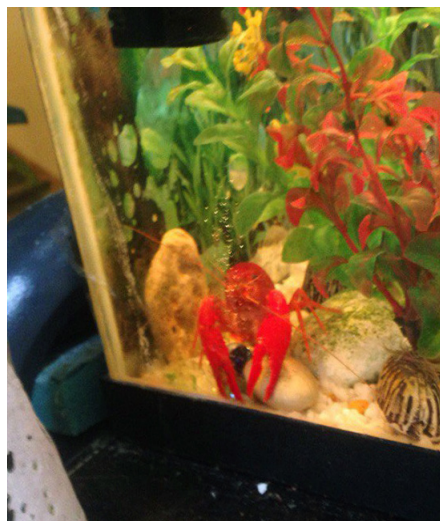
Красный флоридский рак

А между двумя достаточно объёмными аквариумами есть один поменьше, который на первый взгляд может показаться пустым, но ничего подобного! Там обитает красный рак! Он там есть, просто его нужно поискать. Он ярко-красного цвета и с большими усами. Он напоминает мне рака, который в сказке «Дюймовочка» помог героине и двум рыбам. Он кажется таким же добрым и дружелюбным!