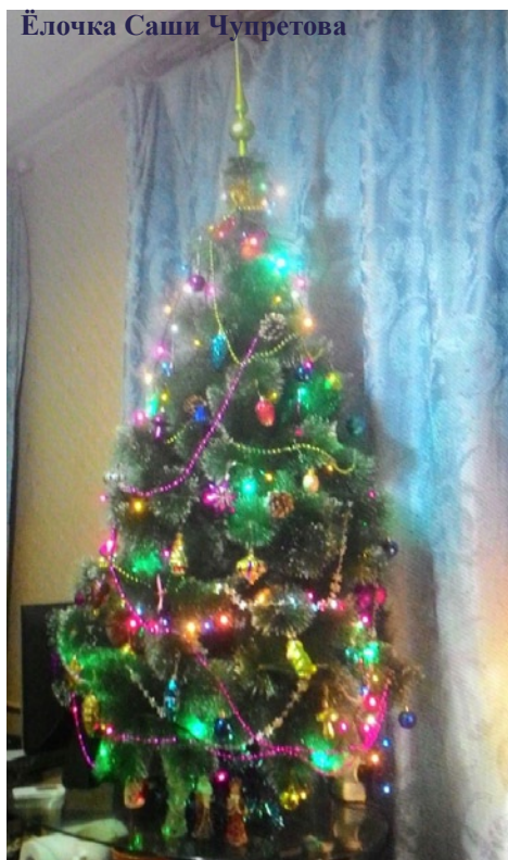
Ёлочка Саши Чупретова