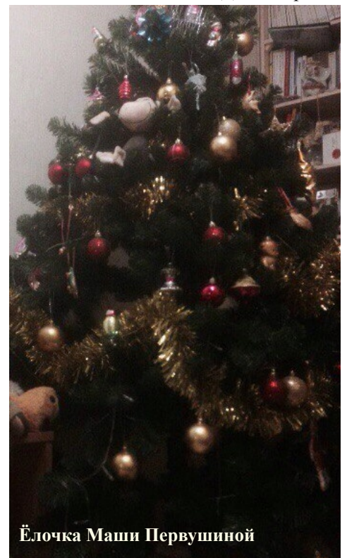
Ёлочка Маши Первушиной