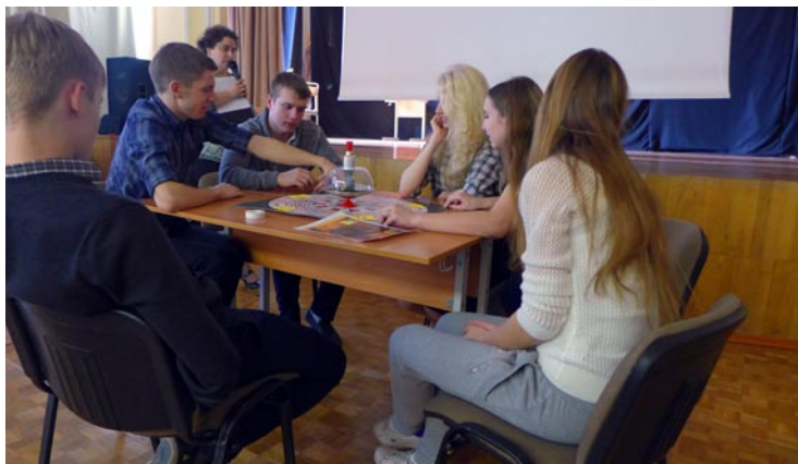
Что? Где? Когда?