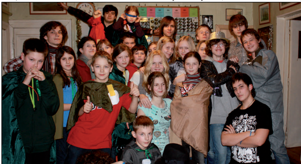
Организаторы и участники 45