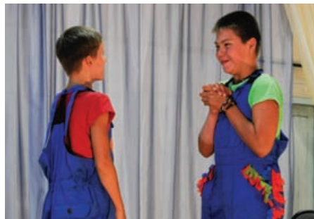
Все персонажи в двух лицах