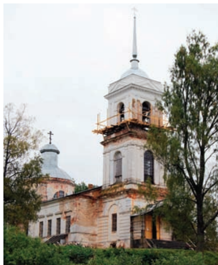
Церковь села Рождество

Екатерине II! Еще в восемнадцатом веке императрица, проезжая здешние места, остановилась в