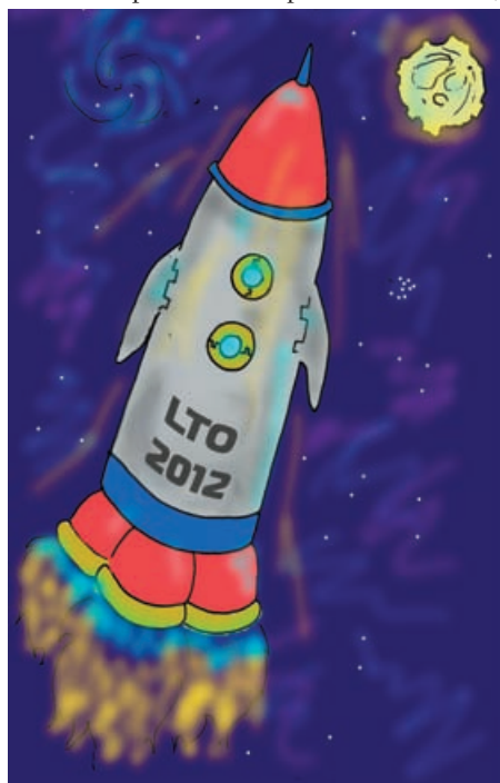
Дорога по-прежнему занимает 9 часов