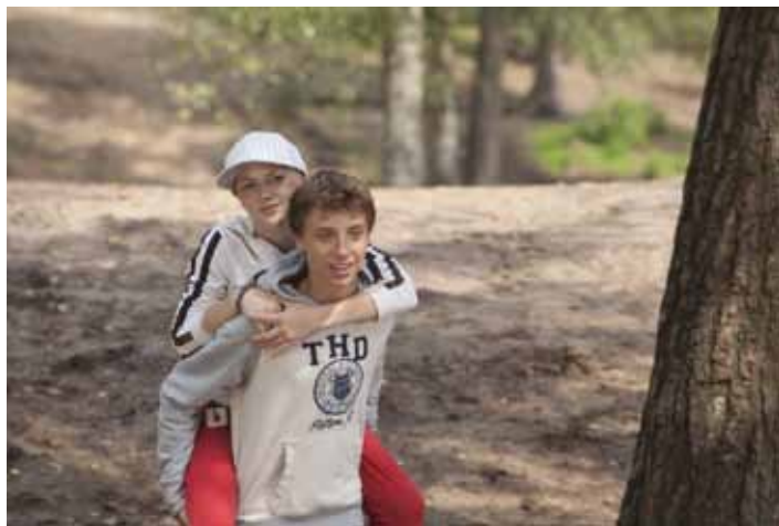
Хорошие дети не плачут

Существует немало грустных фильмов, нагоняющих тоску и злобу. Но есть, как мне кажется, много больше добрых, душевных и оптимистичных. Именно такие фильмы и надо смотреть, те после которых появляется вера в чудеса, в победу, в дружбу, мечту и любовь