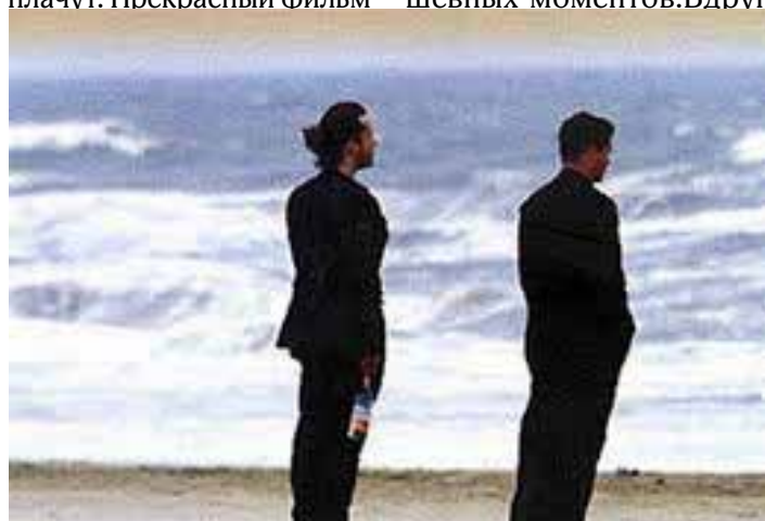
Достучатся до небес

принесли ее кошку. А потом ее класс поехал в лагерь и лечащий врач Экки отпустил ее в этот лагерь, взяв с нее обещание, что она не будет очень много бегать и напрягать свое тело, которое конечно не было выполнено. Этот фильм пропитан любовью, дружбой и тем, как один случай может изменить взгляды и создать в человеке страхи всю оставшуюся жизнь. Смотря этот фильм видишь, сколько людей, готовы поддержать любимого ими человека в момент его слабости. После фильма остаются только положительные эмоции, ну и конечно этот фильм невозможно смотреть без слез, так как там немало добрых и душевных моментов. Вдруг