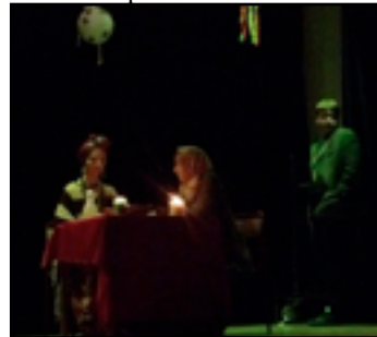
Сеанс у гадалки