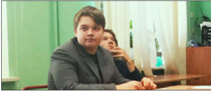
Адвокат и подсудимый