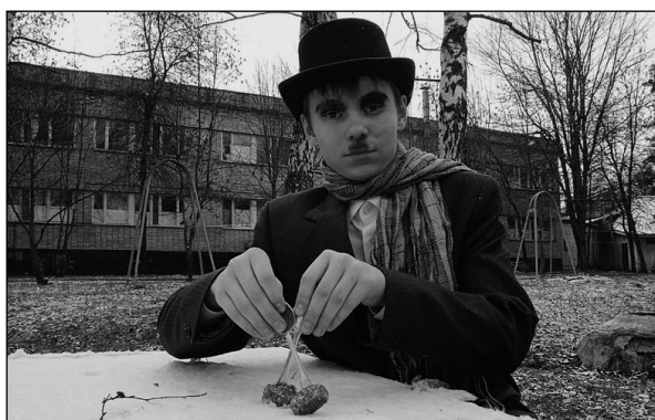
Чарли Чаплин – отряд «Мысля»