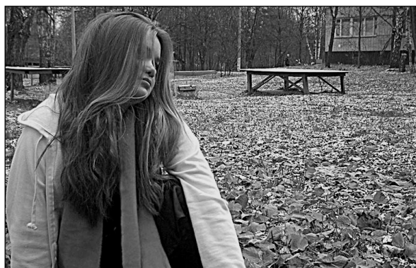
Мэрилин Монро – отряд «Гипотенуза...»