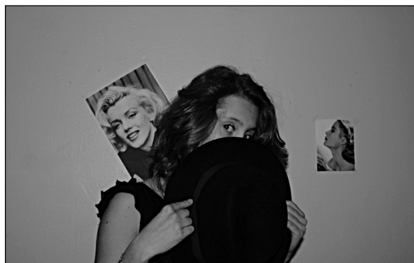
Одри Хепберн – отряд «Полтора века»