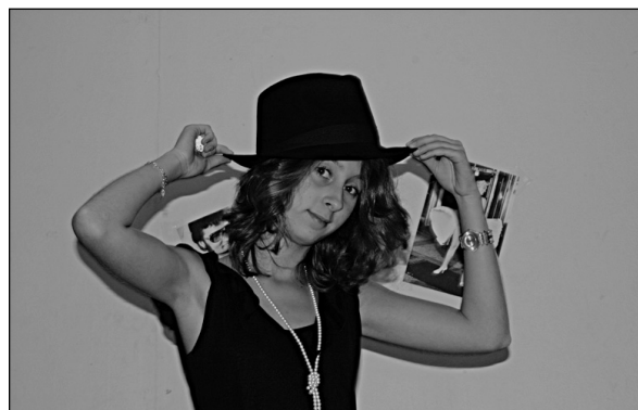
Одри Хепберн – отряд «Полтора века»