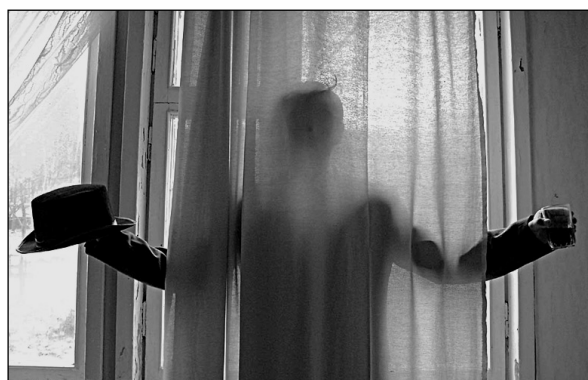
Чарли Чаплин – отряд «Мысля»