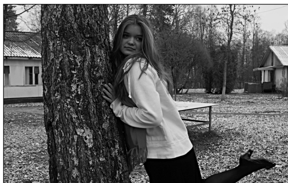
Мэрилин Монро – отряд «Гипотенуза...»