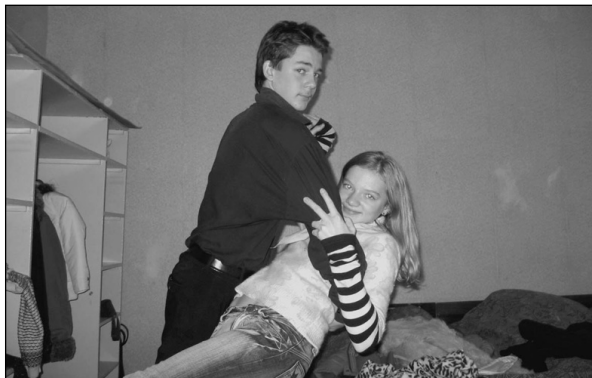
Элвис Пресли – отряд «Кот в мешке»

Фотографии звезд Голливуда, сделанные отрядами из Пушкино