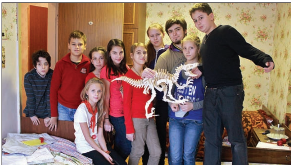
Кости откопанного динозаврика наконец собраны в скелет!

Вот и отшумел второй тематический день нашего осеннего сбора. День динозавров был полностью атмосферным, начиная от костюмов и заканчивая музыкальным сопровождением, представленным голосами динозавров и патетической музыкой из кинофильмов. Что касается конкретно дня, то я бы сказала, что он удался: сюжетная линия была выстроена четко, все роли отыгрывались на «Отлично», и атмосфера не терялась, а совсем наоборот, создавался эффект присутствия. Тем не менее, сценарий был вполне типичен для «Острова Сокровищ»: группа неких людей попадает в некоторый таинственный научно-исследовательский институт, где участвует в каком-то страшном эксперименте, который в конце концов либо проходит успешно, либо заканчивается полным провалом и угрозой существованию нашего мира. Сегодня в частности день закончился тем, что на волю вырвались огромные и опасные динозавры, которые могут уничтожить все живое на очень большой территории. Лично я всеми руками за то, чтобы финал дня или игры был похож на реальность, а именно не заканчивался хеппи-эндом, как в сказках, а мог завершиться, можно сказать, отрицательно, антропогенной катастрофой, например. Но, сказать по совести, мне окончание дня