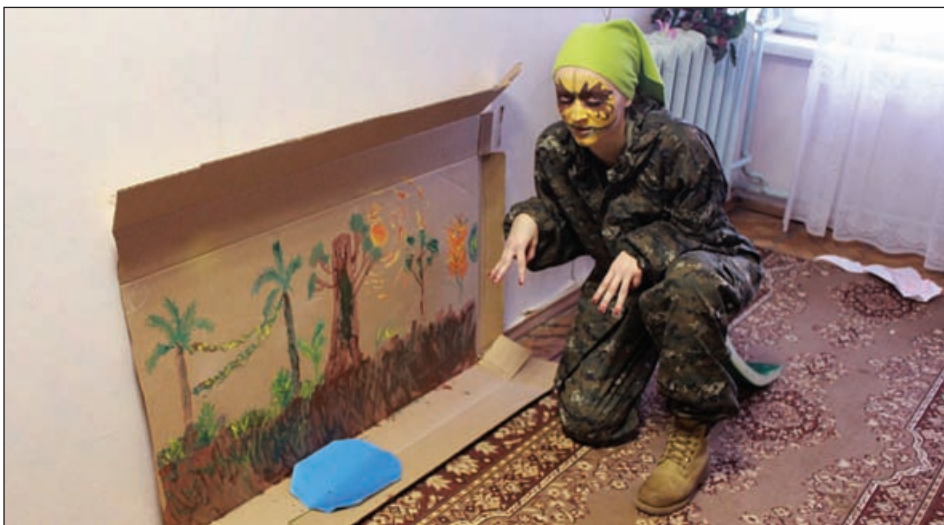
Наш динозавр знакомится с подготовленным для него парком

Ни один цвет динозавра достоверно неизвестен. Да, к сожалению, все раскраски динозавров из многочисленных фильмов, книг, атласов и так далее — всего лишь предмет вымысла авторов. Найти кожу динозавра — большая удача для палеонтолога, и, к тому же, даже она не дает точной информации — за шестьдесят миллионов лет (а именно настолько старше нас самый молодой динозавр) она окислилась, разложилась, одним словом — цвет изменился.