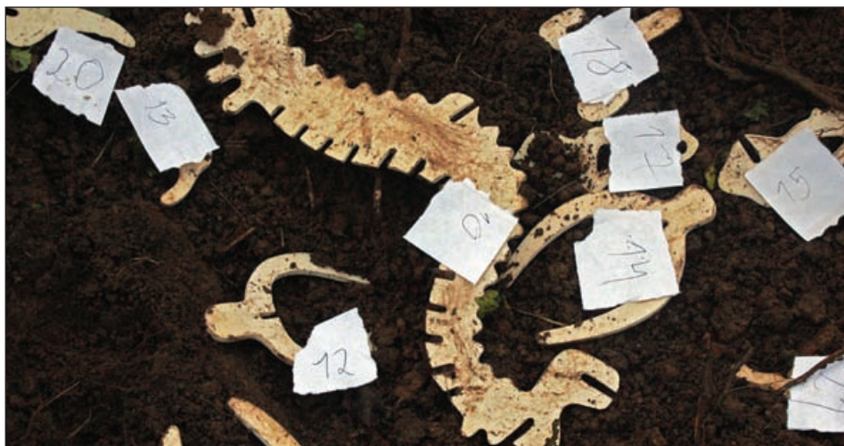
Раскопки дали богатый урожай экспонатов