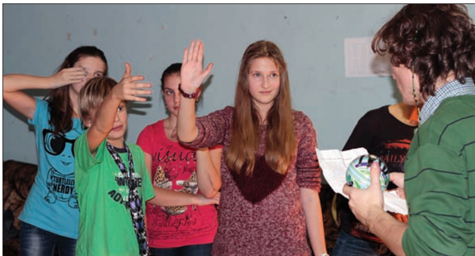
Высказаться на диспуте хотели практически все