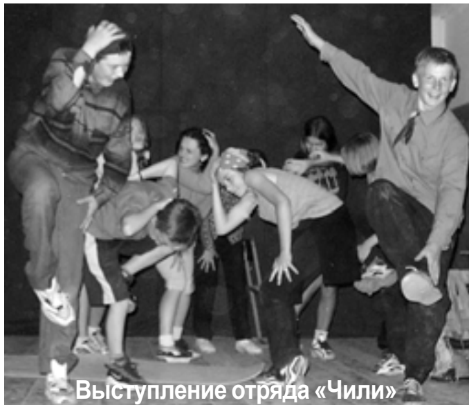
Выступление отряда «Чили»