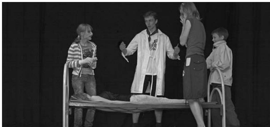
Сердце, тебе не хочется покоя...