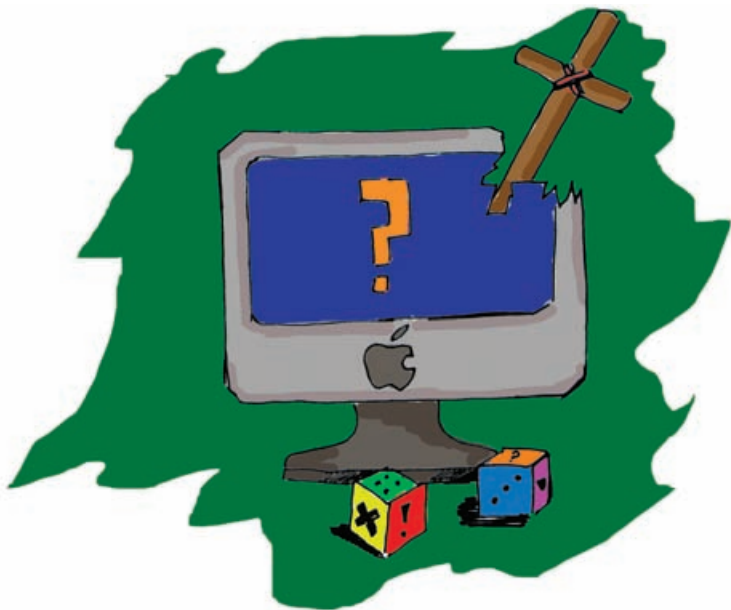
Компьютер, вон, тоже не понимает

На самом деле, было интересно посмотреть, как бы работали профильники, если бы они занимались не своим делом: журналисты – театральными мероприятиями, организаторы – журналистскими планами, и наоборот.