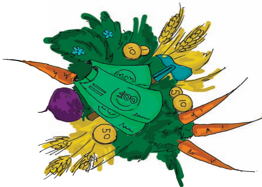
Стоит ли морковка денег?