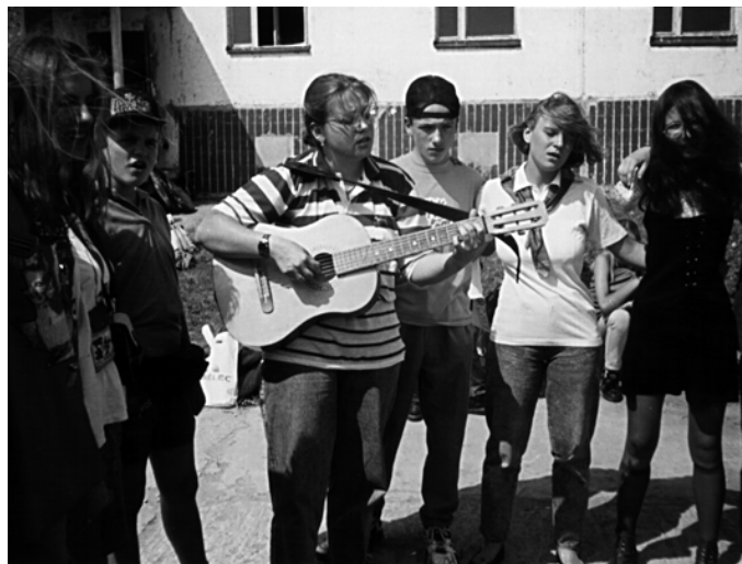
Орлянский круг перед отъездом

Кроме этого нужно было ещё преподнести ему что-нибудь в подарок. Какой-то отряд намазал его зелёнкой. После этого все конечно танцевали летку-енку, сиртаки, калинку-малинку; а потом прыгали через костёр; потом пели песни.