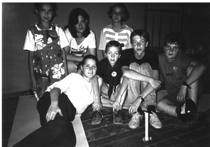
На свечке отряда „Шпана“