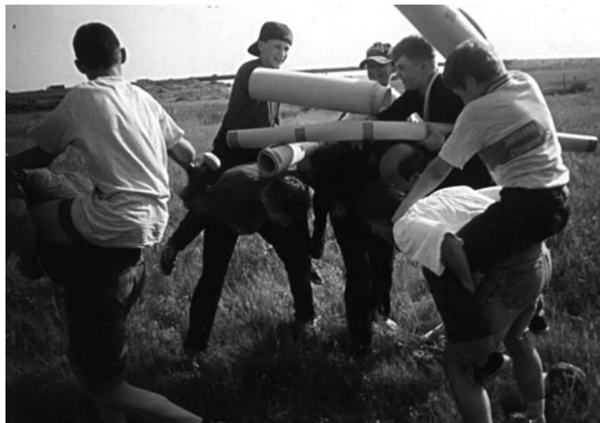
Сражения на рыцарском турнире

Первая трёхдневка была посвящена рыцарству. Сначала был рыцарский турнир, на котором рыцари дрались с друг другом. Сидя на конях, которых изображали комиссары, они дубасили друг другом рапирами, копьями и дубинками. Все виды оружия были сделаны из пенок. На БТД каждому отряду надо было выбрать из своего состава рыцаря, даму его сердца, коня (можно из 2-х человек), вечно преданного оруженосца и дальше уж как получится: тёти, дяди, родители, домашние