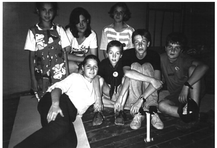
На свечке отряда „Шпана“