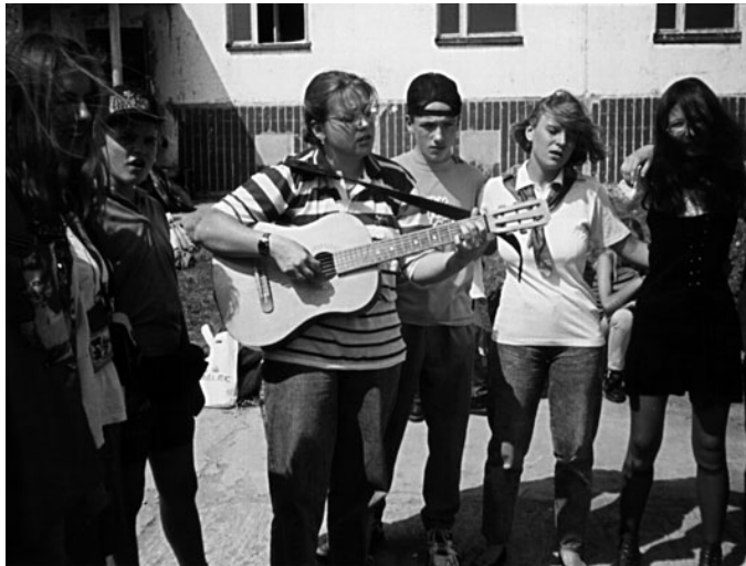
Орлянский круг перед отъездом

Кроме этого нужно было ещё преподнести ему что-нибудь в подарок. Какой-то отряд намазал его зелёнкой. После этого все конечно танцевали летку-енку, сиртаки, калинку-малинку; а потом прыгали через костёр; потом пели песни.