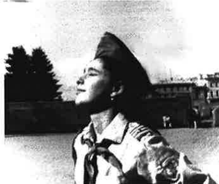
Весело шагать под флагом!