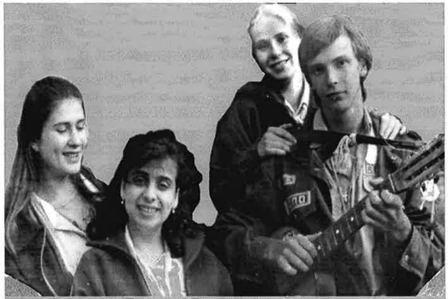
Люди в жёлтых галстуках