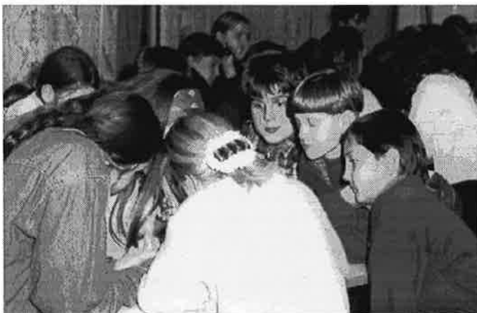
Трудный вопрос попался ребятам на викторине

ра, на котором любой мог приобрести практически все и всего лишь за анекдот или за песню. Но к сожалению, долго торговля не продлилась - султан повелел горожанам представить своих претендентов на наследство. Выбрать среди всех тех наследников, которые на разные голоса кричали о том, что именно они истинные потомки султана, было невозможно. И, в результате, сул-