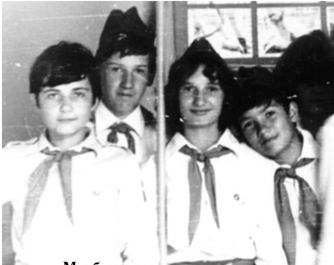
Мы были когда-то пионерами

- Спой что-нибудь, Наташка. - Эх! Мне бы с этими детьми за месяц до лагеря кое о чем договориться... - А может тебе еще и готовый сце-