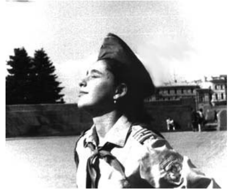
Весело шагать под флагом!