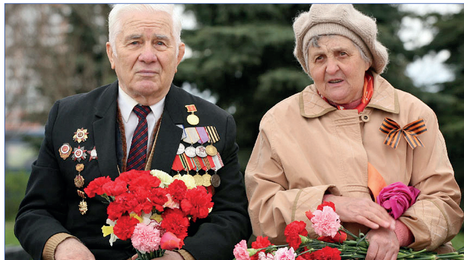
Ветераны — люди, подарившие нам свободу

Но для нынешнего поколения немцев гибель Третьего Рейха — освобождение немецкого народа от гнета тирании,