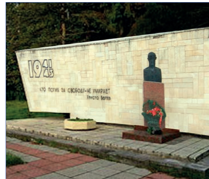
Памятник никогда не остается без цветов.

Мы уехали, а памятник остался ждать основную делегацию нашей гимназии и напоминать нам и всем о героях войны.