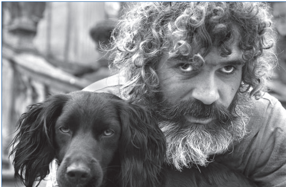
Загляни в их глаза. Достаточно хотя бы поздороваться, чтобы помочь

Само правительство закрывает на все глаза, о чем говорит бесчисленное количество примеров насилия над бомжами и поразительная мягкость приговоров преступникам. К бездомным собакам, заполняющим всю Москву, относятся куда человечнее, чем к живым людям. Вершит суд над бомжами, как правило, молодежь. «В Архангельской области вынесен приговор двум молодым северодвинцам, которые забили до смерти человека. Его смерть наступила от черепно-мозговой травмы, также были выявлены следы побоев, множественные переломы ребер. Молодые люди написали заявления о явке с повинной, в которых указали, что бомжа они обнаружили спящим в подъезде. От него дурно пахло, вот они его заперли и избили. Им дали по пять лет исправительной колонии строгого режима.» - сообщают тексты газет. Кого-то может удивить приговор судьи. Пять лет за убийство человека? Или судьи уже не принимают бомжей за людей? Удивляют и причины убийств: одних не устроил запах и внешний вид бездомного, других просто привлекают жестокие и бесчеловечные поступки. «В Петропавловске-Камчатском от шести до девяти лет лишения свободы получили трое подростков, обвиняемые в убийствах двух бездомных. Преступники отняли у одного из бездомных сотовый телефон, избили его, облили ему ноги бензином и подожгли. От полученных травм потерпевший скончался на месте.» Конечно, никто из них даже не задумывался о том, почему люди потеряли место жительства и вынуждены жить без крыши над головой.