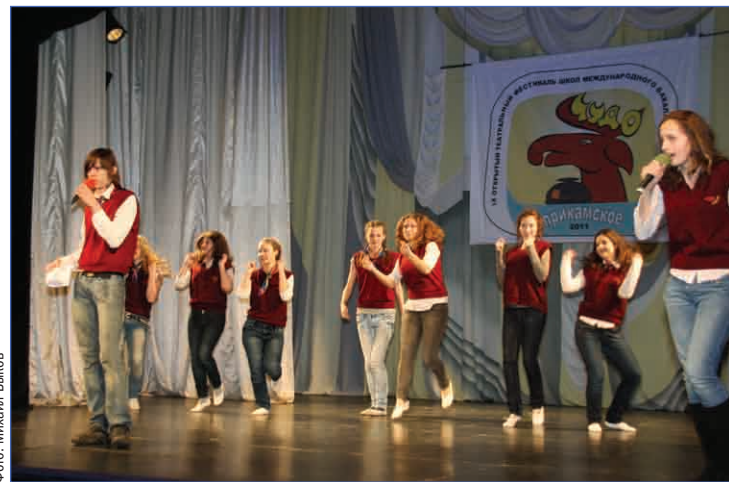
Выступление нашей делегации на закрытии фестиваля

Наши путешествия были не просто экскурсиями по достопримечательностям окрестностей Перми. Пермяки стремились показать нам то, что им дорого, то, чем они гордятся и что они чтут. Именно поэтому каждый выезд нас обязательно сопровождал кто-то из пермской школы № 9 — хозяйки фестиваля. Ребята специально для нас,