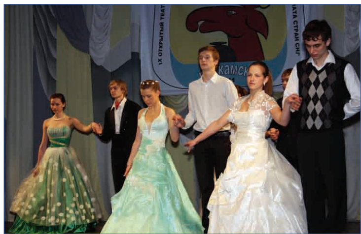
Традиционно бал начинается на сцене Пермского театра кукол

Поездка в Пермь была очень интересной и запоминающейся!