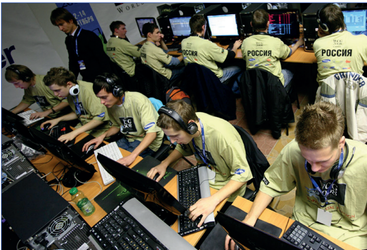
Для многих игры – больше чем просто увлечение

Живите настоящим, друзья! Пока у вас есть возможность бегать, прыгать и наслаждаться каждым прожитым днем. А нажимать на кнопки вы еще успеете!