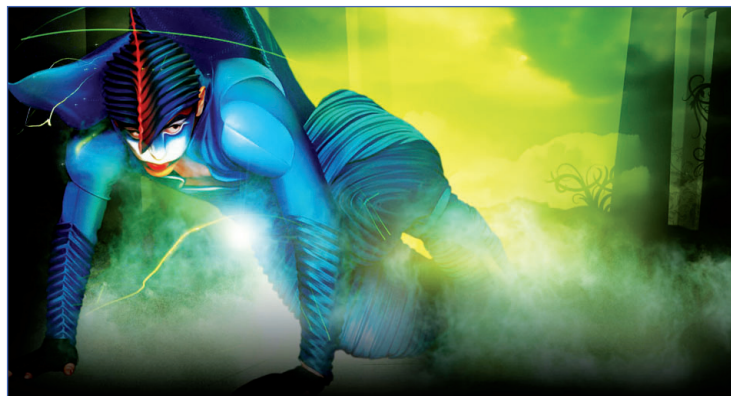
Костюмы и образы персонажей поражают воображение

Если вы не попали на представление «Цирка солнца» в этом году, можно только надеяться, что в 2010м в Лужниках снова появятся остроконечные белые шатры с флагами, ведь отзывы создателей и участников шоу от первого опыта выступления в России и от нашей публики были сплошь положительными. И если у вас такая возможность появится, пусть даже, возможно в другой стране (цирк гастролирует по всему миру), не упустите ее, оно того стоит!