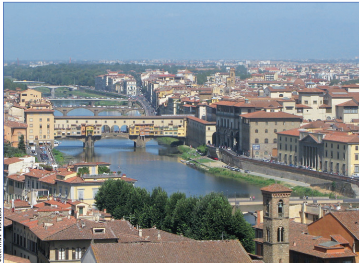
Понте Веккьо — самый древний мост города Флоренции

И, наконец - последнее напутствие. Обязательно познакомиться с итальянцем. Мое знакомство с молодым человеком, работающим на рецепшене нашего отеля, сопровождалось бескончаемыми шутками, стихами и рассказами из жизни на смеси английского, итальянского и русского, невероятным обаянием и доброжелательностью. Флоренция - она ведь такая же, как и ее жители - яркая, обаятельная, впечатляющая и уникальная.