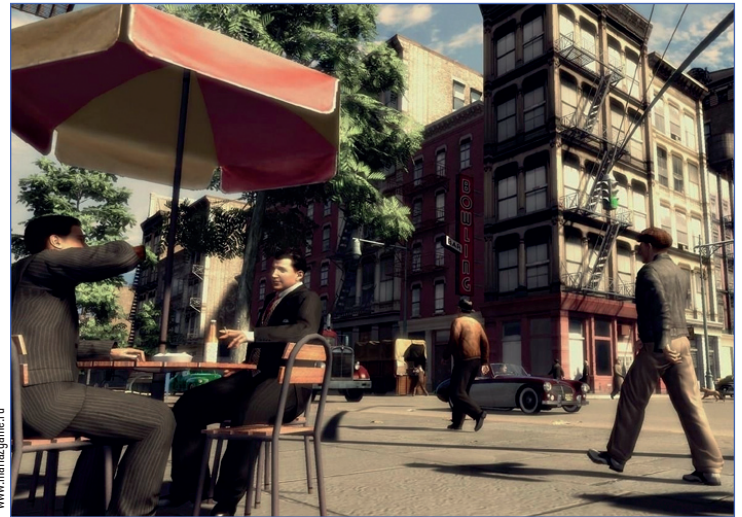
Многие игры поражают колоритной атмосферой

Игры бывают разные и создают невообразимый простор для воображения. После установки вы сможете найти