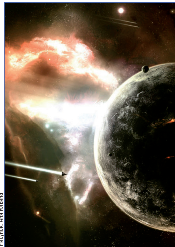
Рисунок Ана Ильина

ло его пилотское кресло, парашют оторвался и висел на дереве, смутно напоминавшем березу. Иванов поднялся на ноги. Метрах в пятидесяти от себя он увидел дымящуюся грудку металлолома, бывшую, совсем недавно, его кораблем. Куски покоруженного металла валялись повсюду вместе с оторванными ветками и целыми, вырванными из земли взрывом, деревьями. Решив, что больше там ничего рвануть не может, Иванов сделал несколько нетвердых шагов вперед, собираясь поискать что-нибудь уцелевшее среди обломков «Зу-11». Но спустя полчаса понял, что ничего полезного там не сохранилось.