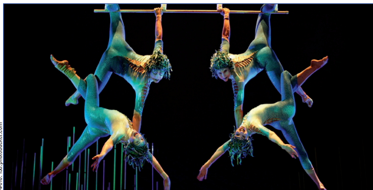
Акробаты, жонглеры, казалось бы – обычный цирк

Еще не все успевают рассесться в шумном зале, как из-за деревьев выползает одно существо, потом другое, третье. Все спешат занять свои места, не утихает общий шум, а они уже надвигаются на зрителей,