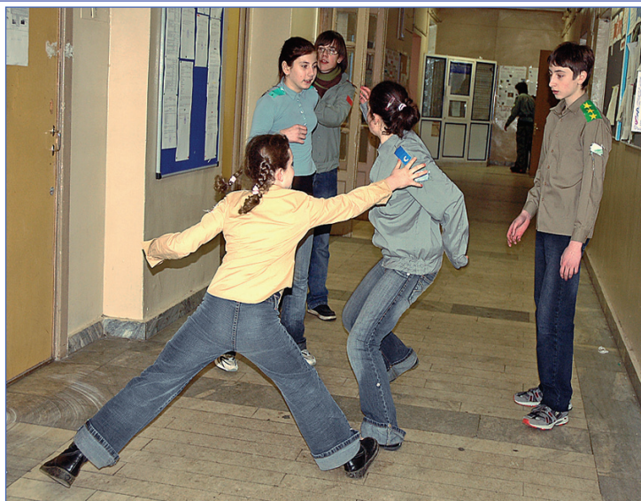
Сестра на сестру

Так проходят вводная за вводной. Отдыхать нет времени, хотя если не расслабляться и не давать себе уставать, то прожить в принципе, можно. Скоро конец дня.