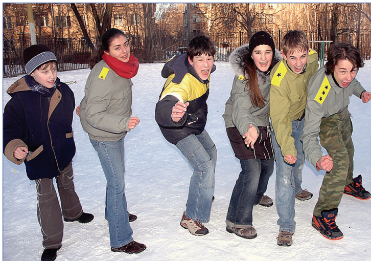
Взвод «Восток» весьма агрессивен!

Итак, взвод, равняйся! Смирно! Взвод, вольно разойдись. Разойдись до следующей Зарницы. С нетерпением ждем.