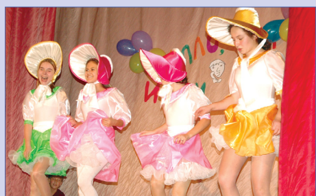
«Алло, мы ищем таланты» 2 ▶

Печатный орган детской организации "Остров Сокровищ" Гимназия №45 Газета основана в 1997 году