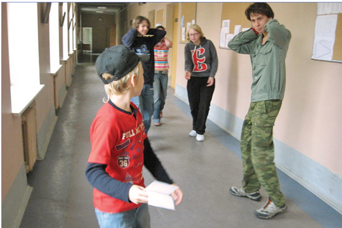
Руки за голову! Лицом к стенке! Работает ОМОН! Не понял?

Игра делилась на периоды по 15 минут, эти периоды, в свою очередь, делился на два этапа: обсуждение и действия. Первую половину периода группы сидели в своей комнате («космическом корабле», «церкви», «пещере») и обсуждали, что же они будут делать. По свистку выходили на «общую площадь», где и происходили основные и самые интересные действия.