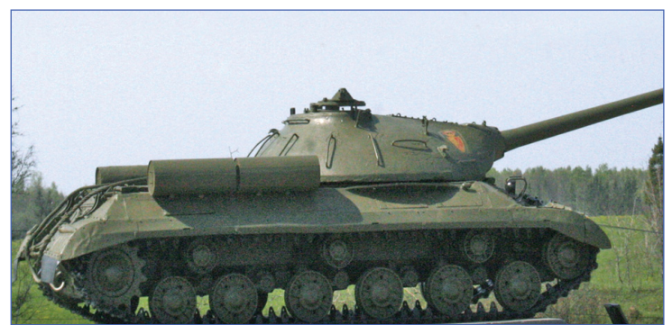
Немой свидетель битв жестоких...

Но это направление больше знаменито памятниками и многочисленными музеями, посвященными Бородинскому сражению. Если ехать по этой дороге, то можно попасть в деревню Бородино. Доехав до этой деревни, можно попасть на всем известное Бородинское поле. И вот что рассказывают книги о поле, на котором мы дважды сражались с иностранными завоевателями: «Еще одно подразделение – 40-й моторкорпус фашистов – устремился вдоль Минского шоссе и оказался в районе Бородина. Почти в те же дни осени, что и в 1812 году, Бородинское поле стало свидетелем новой жестокой схватки наших солдат с чужеземными завоевателями. С особым мужеством дралась там дивизия полковника Полосухина. Эти войны ни каплей не запятнали честь предков. Их героизм, пре-