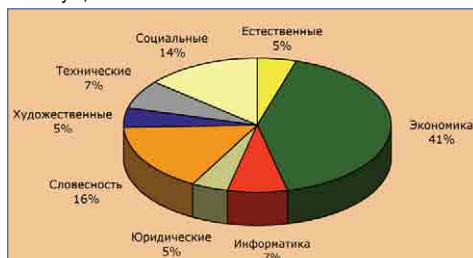
Распределение по специальностям