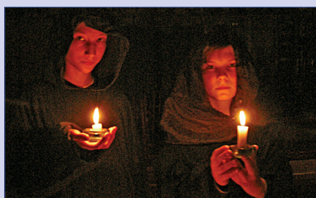
Форт Боярд 6 ▶