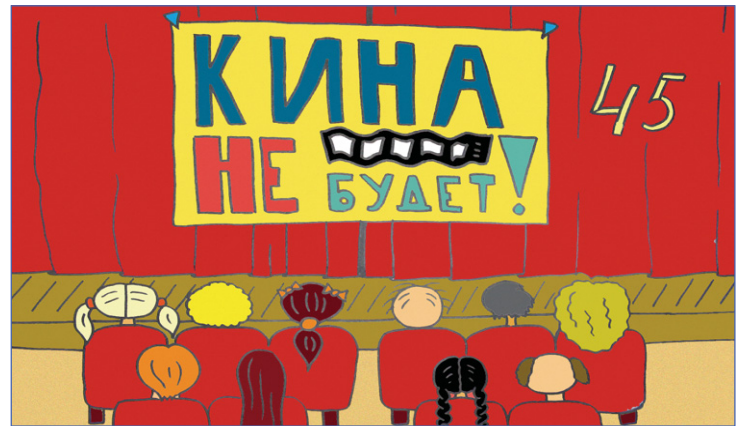
Спектакль отменяется, актеров не ждите.

Возьмем экстренный случай – вы учитесь каждый день по 10 уроков, а после бегите ухаживать за бабушкой, потом за дедушкой, потом на курсы, а еще, чтобы их оплачивать работаете ночью на автозаправке, а в выходные снимаете комнату прямо в квартире репетитора, чтобы круглосуточно заниматься. Почему же вы молчали? Вот добропорядочный Дубильт не очень заранее, но предупредил-таки, что