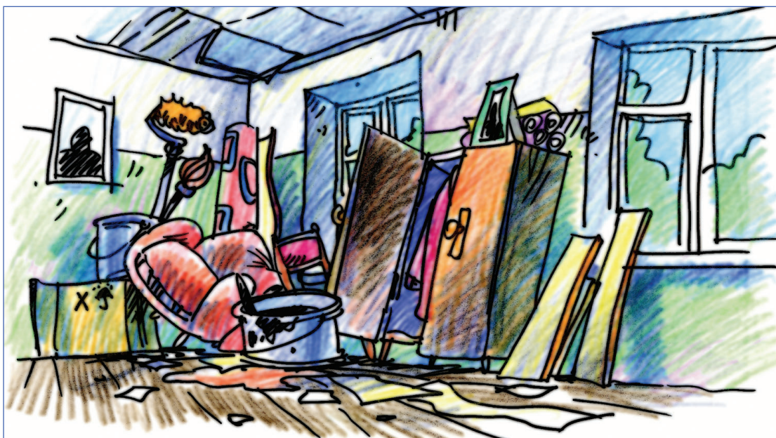
Большой беспорядок процветает

Итак, первое сентября. День, который назвать праздником, по моему, все же нельзя (совсем не потому, что приходится снова идти в школу, делать уроки и т.д.), всегда оставляет какие-то памятные, хорошие ощущения, был омрачен таким событием - центральная часть четвертого этажа была перекрыта партами, да и вообще, выглядела не лучшим образом. Новые двери обтянуты грязной пленкой, отделка еще не завершена. И, что самое неприятное, кабинет информатики закрыт наглухо. Как же так? Ведь iMac'i всегда составляли большую часть особого колорита нашей школы, были кусочком легенды. Увидеть их вновь нам удастся лишь во втором триместре. С одной стороны, конечно, хорошо, что сначала все смогут в очередной раз узнать, что производителями процессоров являются не только Intel и AMD, но и советский завод имени