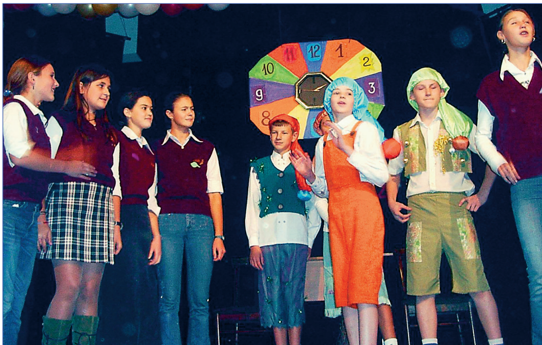
“Мы охраняем часы знаний!”

Но все оказалось не так просто. Для того, чтобы получить хотя бы одну из них, пришлось выполнять различные задания, которые им давали волшебники. Благодаря уму, ловкости, смекалке и стремлению к победе ребята справились с задачей, хотя они проходили через действительно сложные испы-